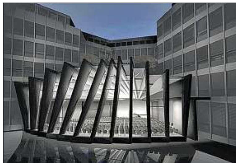
Glänzender Bau im Sternenlicht: So stellen sich Verantwortliche den neuen GKB-Saal an der Engadinstrasse vor.

Mit dem Umbau und der Umgestaltung wurde das Churer Architekturbüro Domenig Architekten beauftragt. Die Kosten für den