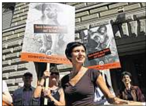
Nationalrätin Pascale Bruderer bei der Einreichung der Tierschutz-Initiative. (Ky)

Der Schweizer Tierschutz (STS) hat gestern die Tierschutzanwalts-Initiative eingereicht. Ziel des von 148 000 Personen unterzeichneten