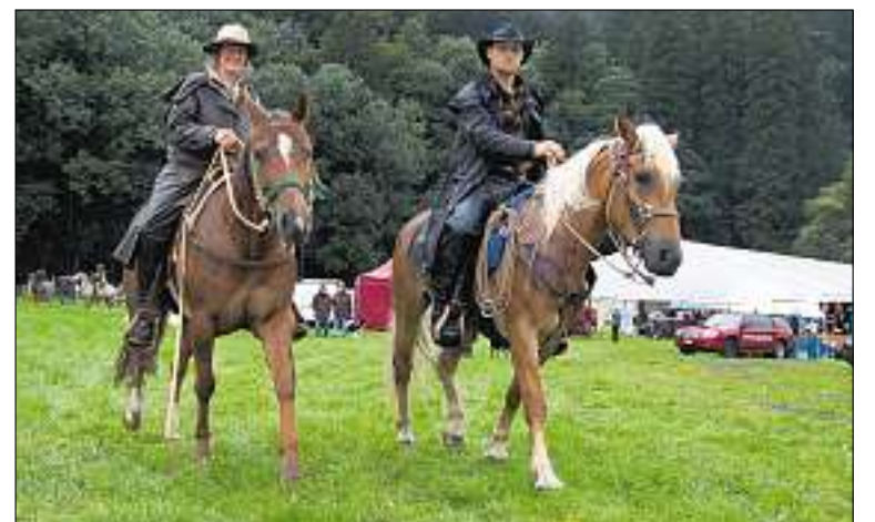
Am diesjährigen Festival standen Pferde im Mittelpunkt.