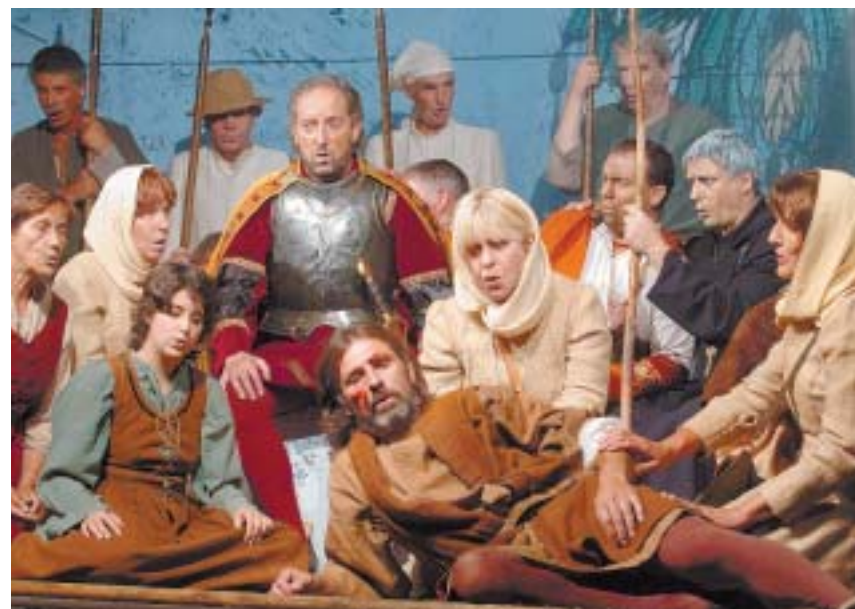
Grosse Oper, wie sie Giuseppe Verdi berühmt gemacht hat: Duette und Ensembleszenen treiben die Handlung in «I Lombardi» über zwei Stunden lang voran.