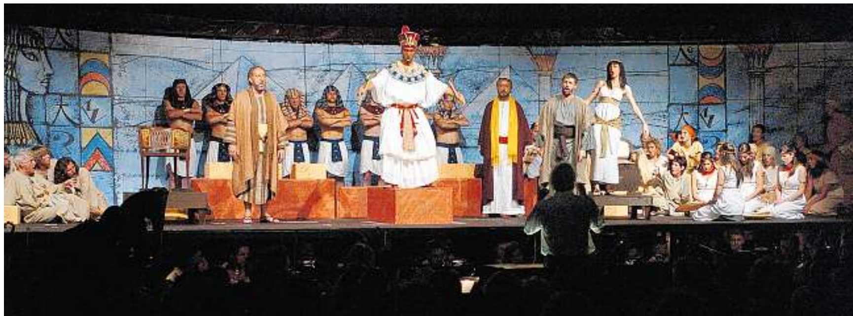
Ein Volk in der Knechtschaft: Moses und seine Landsleute sind in Ägypten zum Frondienst für den Pharaon verdammt – bis ein Zeichen Gottes zum Aufbruch mahnt.

Das Projekt Opera viva reitet nach wie vor auf der Erfolgswelle. Gioacchino Rossinis Oper «Moses» ist am Freitag in Obersaxen vom Premierenpublikum mit wahren Beifallsstürmen aufgenommen worden.