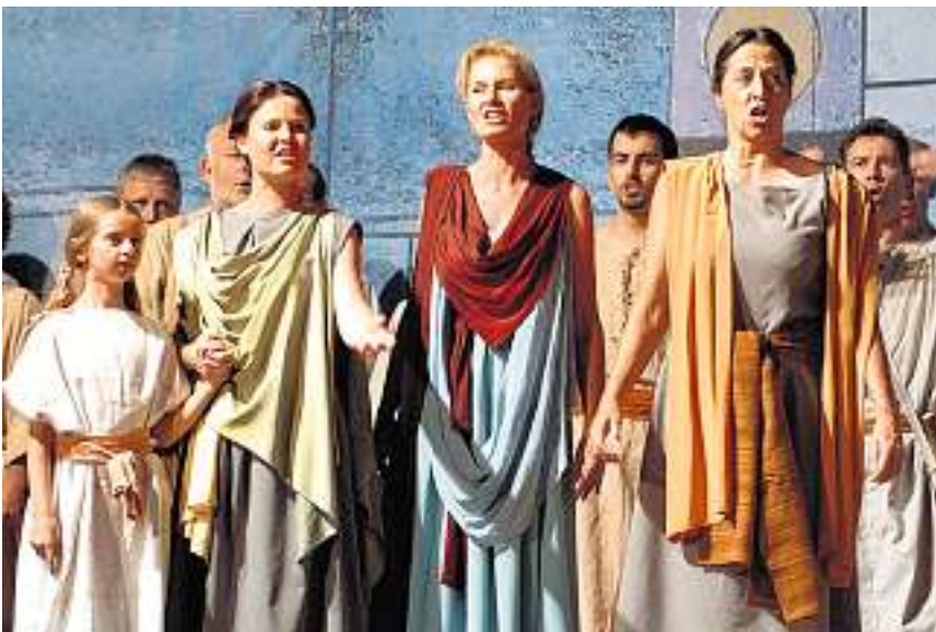
... leistet Moses Überzeugungsarbeit unter den Angehörigen seines Volkes (links), bis diese die Sklavenfesseln abwerfen (rechts) und ins Gelobte Land aufbrechen.

Weitere Vorstellungen: Heute Sonntag und 31. Juli sowie 2., 4., 6., 8., 10. und 12. August, jeweils 20.30 Uhr, Zeit, Obersaxen.